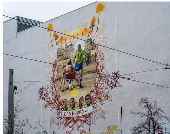
soccer , by János Balázs (CC BY-SA 2.0)

idw – Informationsdienst Wissenschaft informiert regelmäßig über Forschungsprojekte und -ergebnisse, Kooperationen, Tagungen, Publikationen etc. aus der deutschsprachigen Wissenschaftsszene.