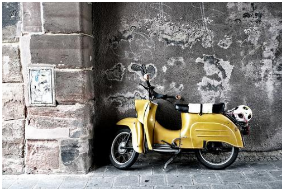
Schwalbe und Fußball, Nürnberg

Einen übersichtlichen Vergleichstest der einzelnen Print-Sonderhefte zur WM gibt es via Meedia.